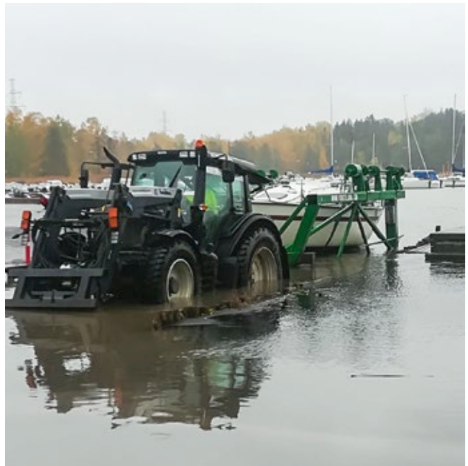
Syyspuhteita, maston nosto. Kuva Katrin Bachmann, 2017. Veneen nosto korkean veden aikaan. Kuva Katrin Bachmann, 2017.

paikoilleen myös laiturista tolppiin viritettyjen sivuköysien avulla. Liian lyhyillä peräköysillä ei välttämättä pääse hyppäämään laiturille asti. Tiedämme, mikä on S-vetolaite ja huomasimme, että myös purjehtiessa voivat akut irrota ja sähköt sammua. Kelluvaan avaimenperään ei kannata laittaa liikaa avaimia. Trossin palvelu on jokaisen euron arvoinen ja Ukko-