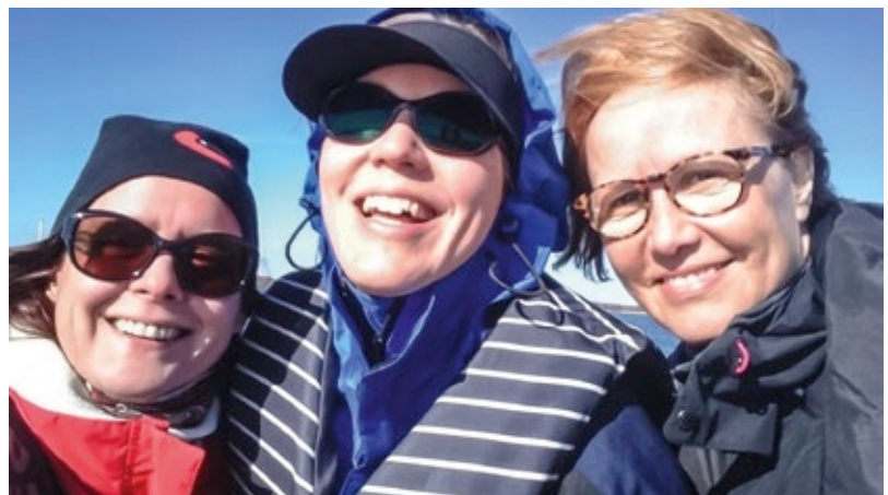
Onnelliset purjehtijat Airistolla. Kuva Katrin Bachmann, 2017.

olivat jo lupautuneet auttamaan ja opettamaan, piti teoreetikkojen löy- tää vielä jokin käytännön kurssi, jolla voisi esittää ne hölmöimmät kysy- mykset ja jossa joku näyttäisi kädestä pitäen perusasioita yhä uudelleen ja uudelleen. Onneksi kevätkauden runsaasta kurssitarjonnasta löytyi juuri sopiva kolmen illan intensiivi-