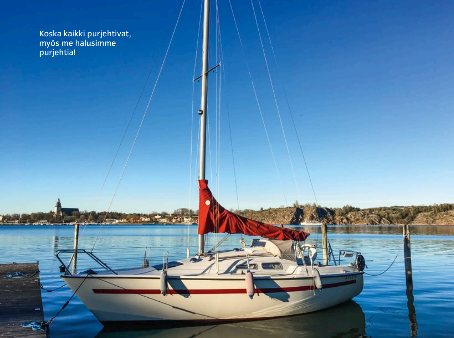
Aphrodite kotisatamassa.

Koska kaikki purjehtivat, myös me halusimme purjehtia!